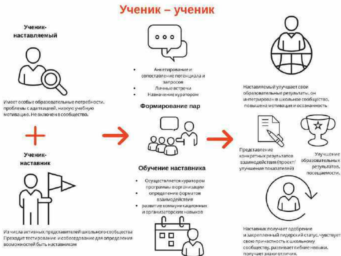
Рисунок 1. Графическое представление реализации программы наставничества по форме «ученик – ученик».