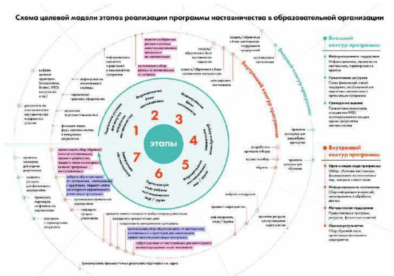
Рис. 6. Схема целевой модели этапов реализации программы в образовательной организации

Содержание каждого этапа, представленное в виде направлений работы с внутренним и внешним контурами, содержится в таблице 1 «Целевая модель этапов реализации программы наставничества в образовательной организации». В таблице 2 «Целевая модель программы наставничества в образовательной организации» представлены основные компоненты программы наставничества.