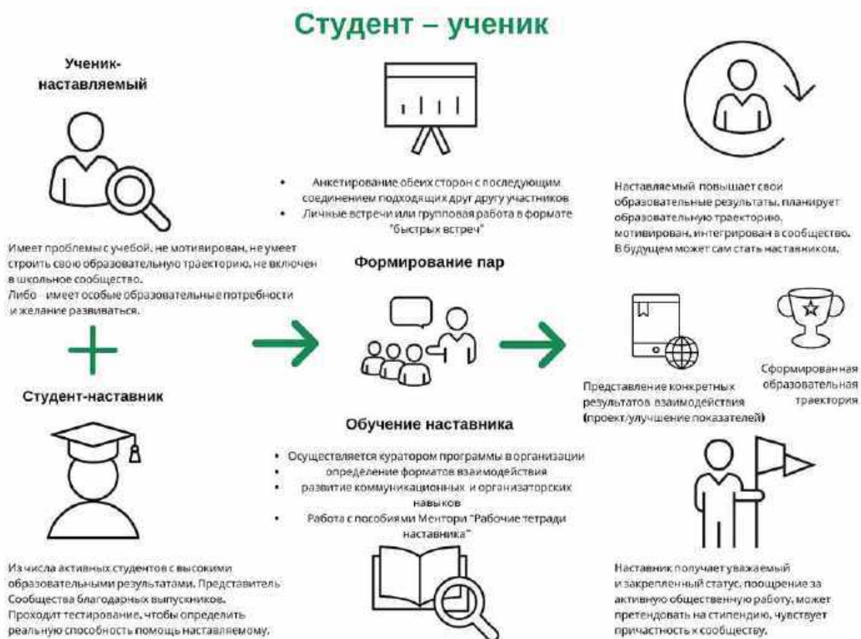
Рисунок 3. Графическое представление реализации программы наставничества по форме «студент – ученик».