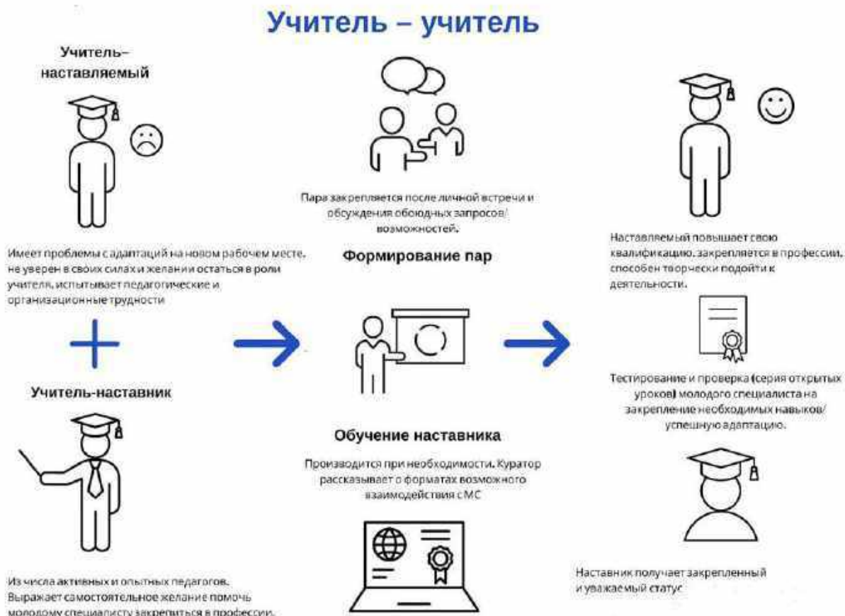
Рисунок 2. Графическое представление реализации программы наставничества по форме «ученик – ученик».